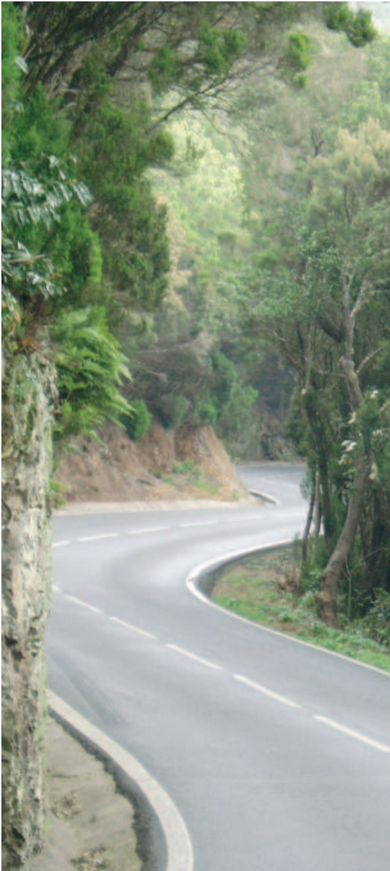
Monteverde del Macizo de Anaga