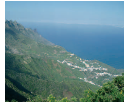
Vista de Taganana desde el mirador del Bailadero