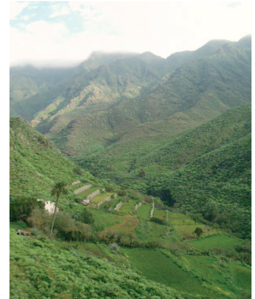
Bancales de cultivos en el Parque Rural de Anaga

Hábitats naturales y vida rural tradicional de montaña conviven en este Parque Rural, donde un sinfín de caseríos, aprovechan las laderas de los valles para realizar desde