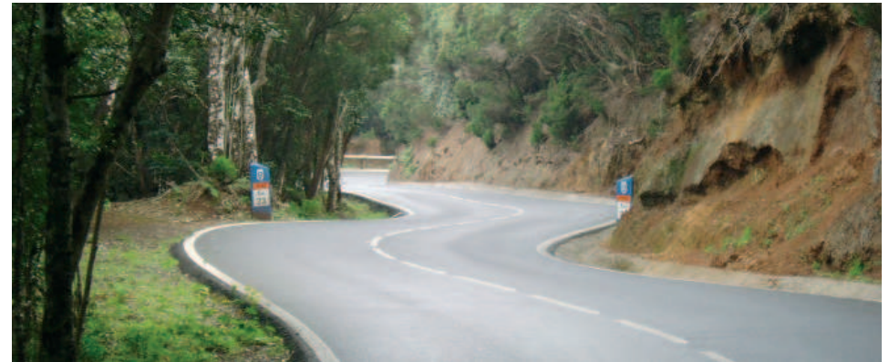
Camino hacia La Laguna por los bosques de Anaga

La extensa red de caminos tradicionales, hoy una red de senderos, descubrirá a los amantes de la montaña esta simbiosis entre espacios naturales de gran valor natural y ancestrales formas de vida. Si el viaje se pro-