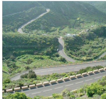
Carretera de ascenso desde San Andrés

antaoño una agricultura dura, de autoconsumo.