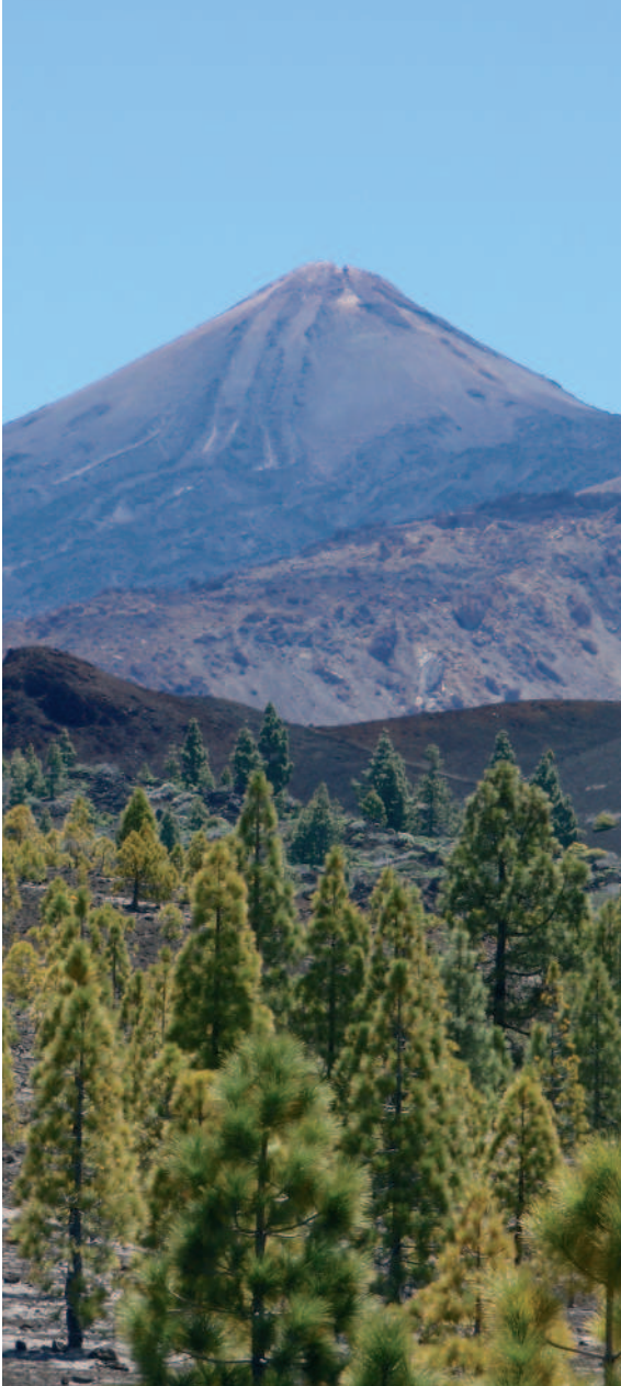
Pinar seco con el Teide al fondo