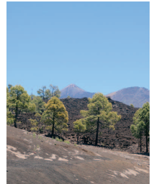
Reserva Natural Especial del Chinyero

El final de esta vía conecta con la carretera TF-82, que comunica Icod de los Vinos, en el norte de la isla, con Armeñime, población del suroeste de la isla perteneciente al municipio de Adeje.