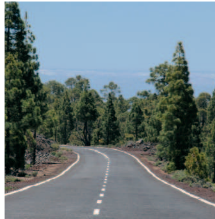
Pinar de Chío

erupción ocurrida en la isla de Tenerife, acaecida entre los días 18 y 27 de