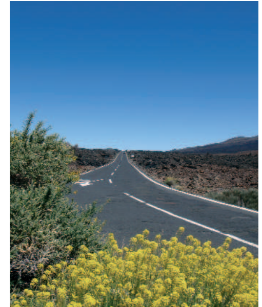
Extremo suroeste del Parque Nacional del Teide

A medida que avanzamos, aumenta la presencia de pinar seco, formación vegetal en la que predomina el pino canario ( Pinus canariensis ), endémico del archipiélago. En el kilómetro 8,4, y aún en el dominio del hábitat de pinar seco, entramos en el Parque Natural de Corona Forestal, cinturón forestal que circunda el Parque Nacional del Teide. A la altura del kilómetro 12,5, tiene su origen el desvío hacia el área de acampada del Pinar de Chío. Es en este tramo, alrededor del kilómetro 15, donde circulamos más cerca del volcán Chinyero, protagonista de la última