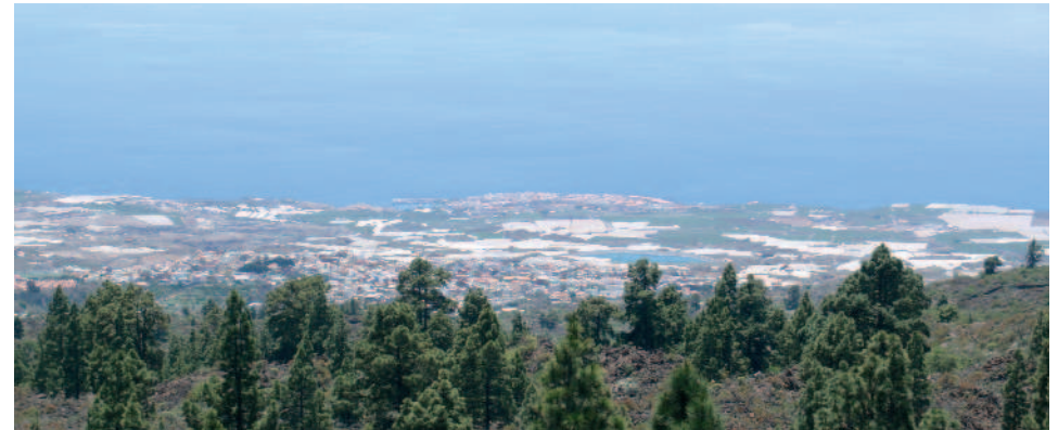
Panorámica de costa oeste de la isla de Tenerife

noviembre de 1.909. El paisaje de lavas, situado alrededor del volcán, está protegido bajo la denominación de Reserva Natural Especial del Chinyero.