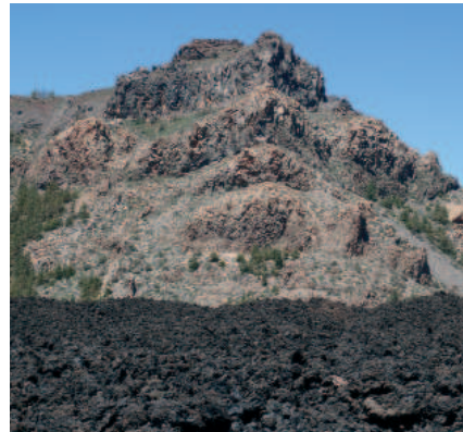
Lavas negras del volcán Pico Viejo

erupción ocurrida en la isla de Tenerife, acaecida entre los días 18 y 27 de